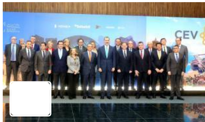
Amplia presencia política y económica