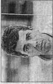
CARLOS MAZÓN PRESIDENTE DE LA DIPUTACIÓN

«Cada millón invertido en obra pública crea de 20 a 25 empleos»