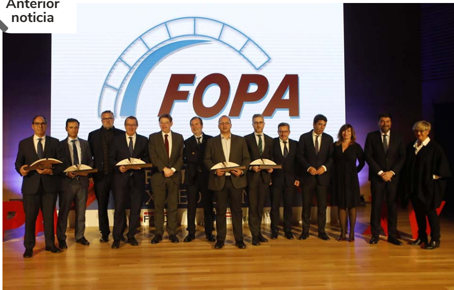
Premiados y autoridades ayer en el Adda. | E3