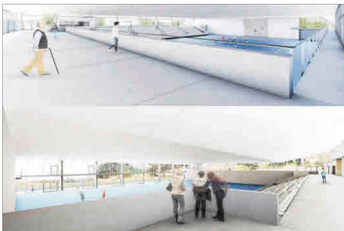
Recreación virtual del pabellón de Xixona, cuya licitación de obra permanece desierta.

El beneficio medio de las empresas dedicadas a la obra pública es del 4%. Un escaso margen que,