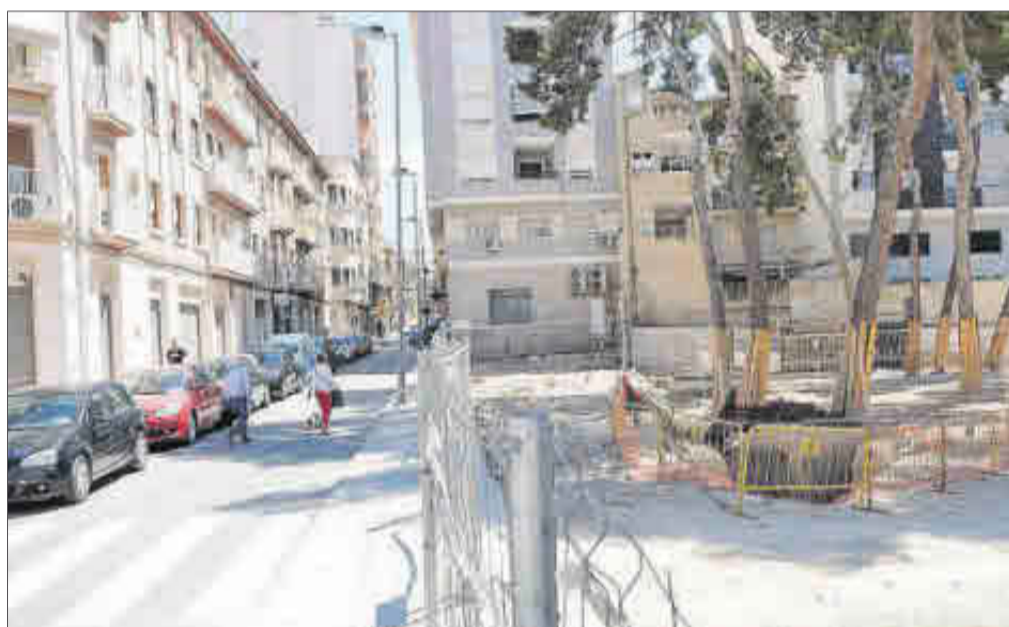
Las obras del IES Andreu Sempere de Alcoy y de la plaza de la iglesia de Ibi siguen paradas, al igual que las plazas Joan Miró y el Jardín de la Música en Elda.