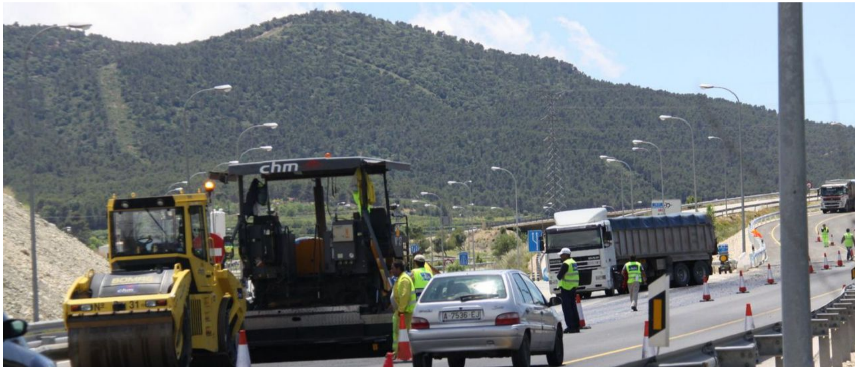
Obras de acondicionamiento de una carretera. | INFORMACIÓN

Los empresarios de la construcción alertan del riesgo de desaprovechar fondos europeos si los precios no se actualizan