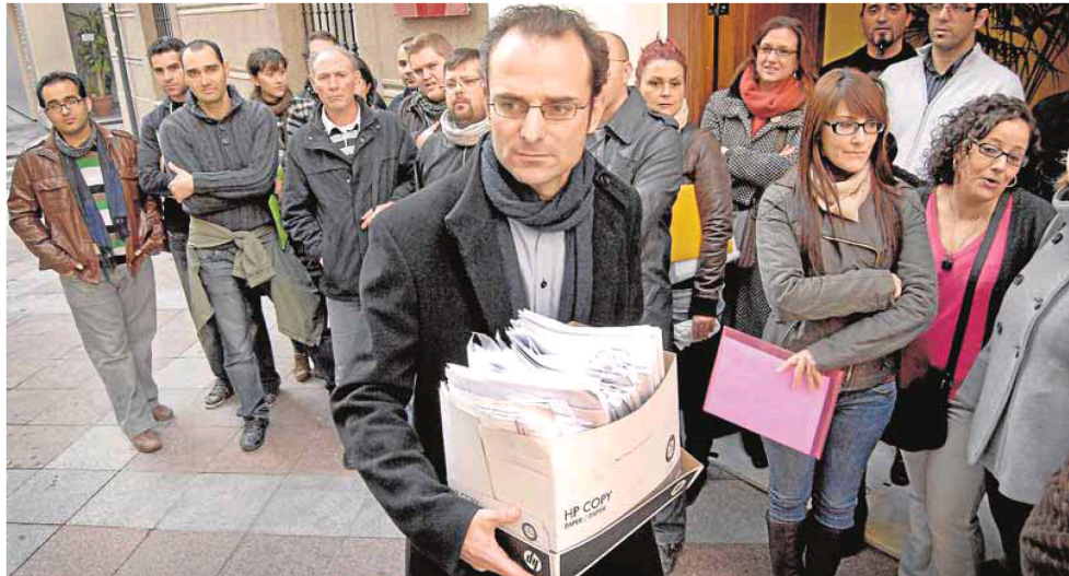
Miembros de la plataforma de afectados por impagos a la VPO en Alicante, ante el Síndic de Greuges el año pasado.