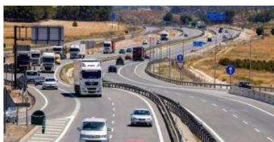
La autovía A-7 es una de las carreteras con más presión de España al ser la ruta que conecta la Comunidad Valenciana con Murcia y Andalucía.

El Ministerio de Fomento ha sacado a exposición pública durante 30 días el estudio de viabilidad del proyecto para ampliar la autovía Alicante-Murcia en el tramo de 72 kilómetros que separa Crevillent de Alhama, cuya obra se ha dividido en cuatro tramos, de los que uno de 18 kilómetros, será de nueva construcción y los otros tres contarán con un carril más en cada sentido. El Gobierno quiere tener lista la «nueva» autovía en cuatro años , en el horizonte de 2022.