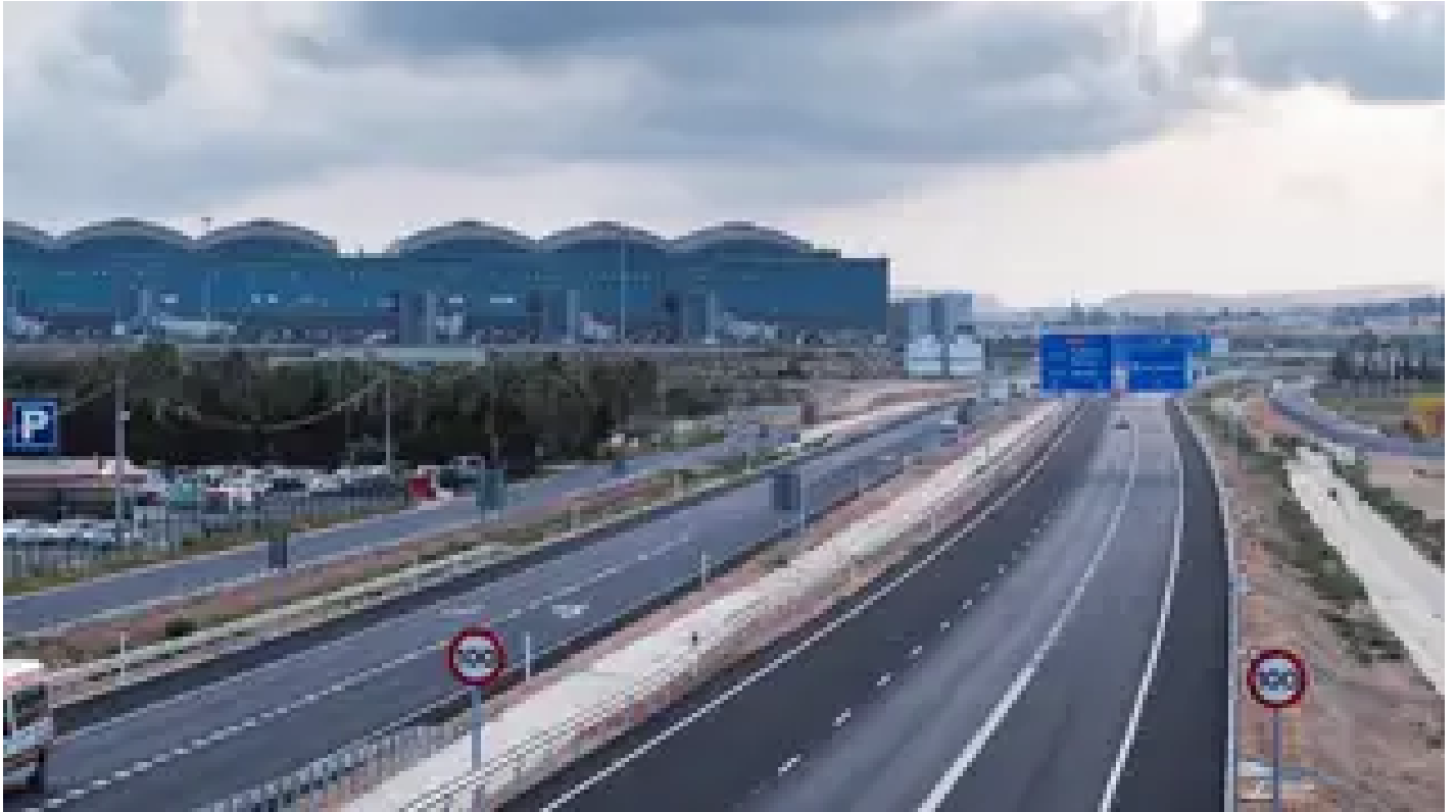
Carretera N-338 de acceso al Aeropuerto de Alicante-Elche.

El Ministerio de Transportes, Movilidad y Agenda Urbana ha recibido el premio FOPA a la mejor obra por la duplicación de calzada de la carretera N-338 de acceso al Aeropuerto de Alicante-Elche 'Miguel Hernández' , llevada a cabo por la dirección general de Carreteras en la provincia de Alicante.