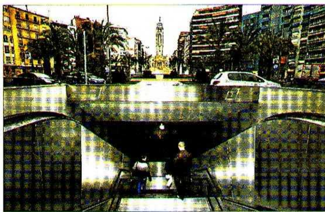
Dos pasajeros acceden a la estación de Luceros. PILAR CORTÉS