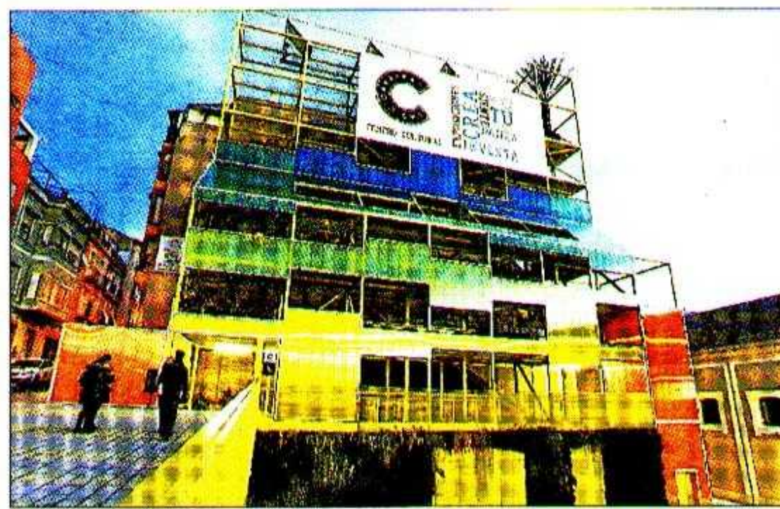
Entrada al nuevo centro cultural «Las Cigarreras». JOSE NAVARRO

nunicaciones en ciudad de Alicante y su área adyacente.