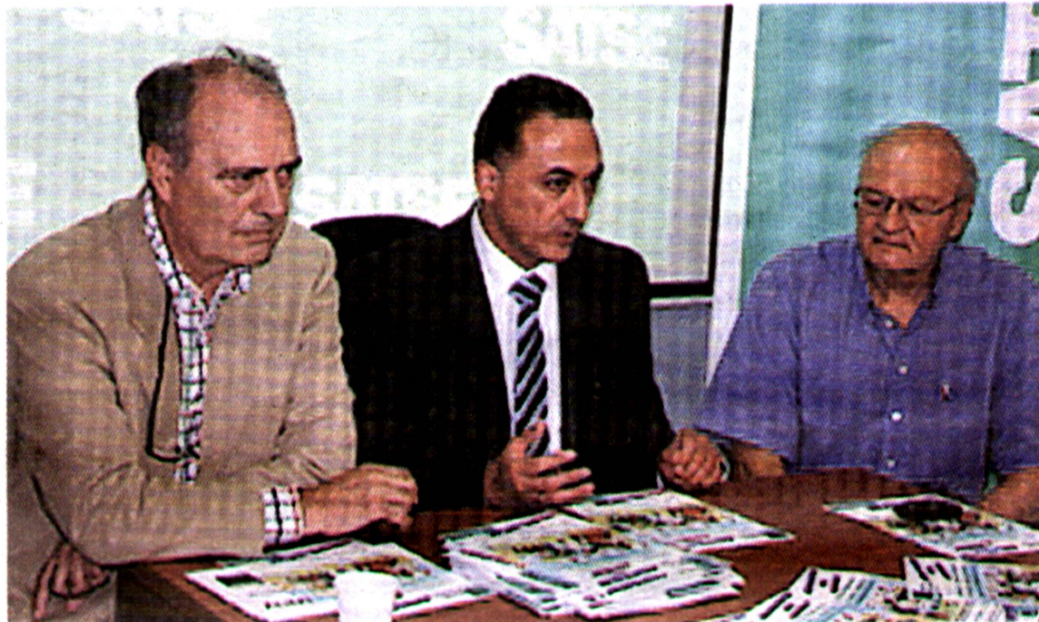
El responsable de Cáritas, el secretario provincial del Satse y el director del Banco de Alimentos.